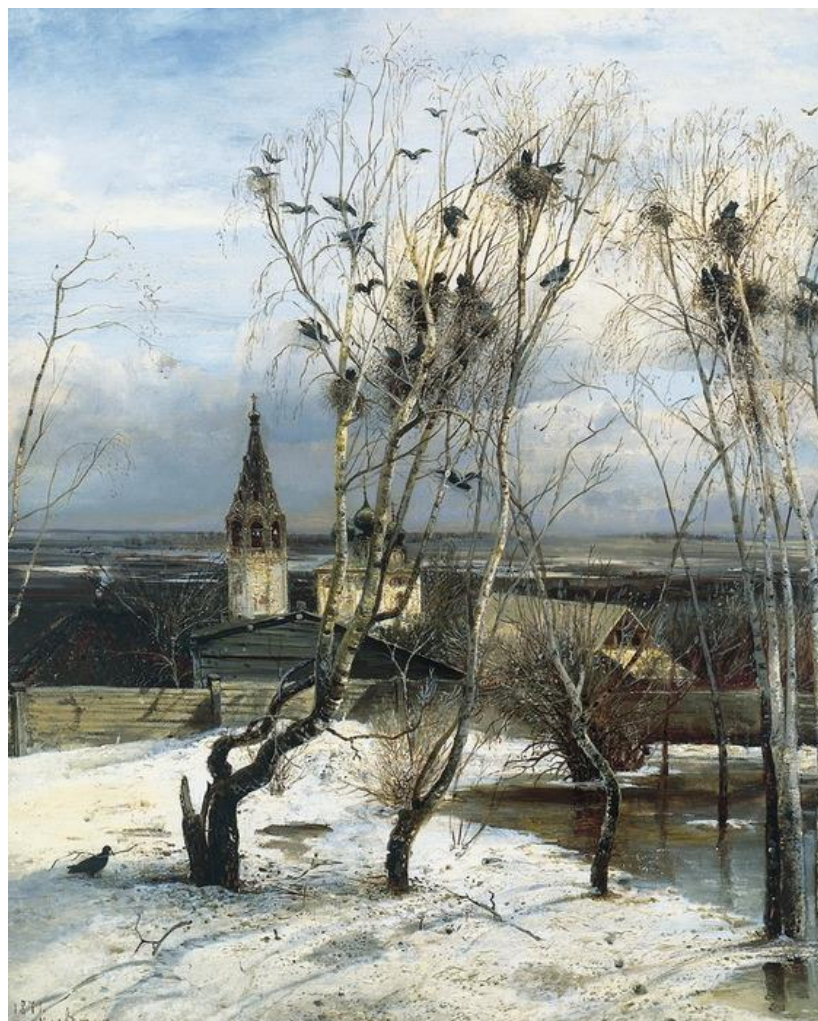
А. Саврасов. «Грачи прилетели»

Проанализировать произведение по следующим параметрам: